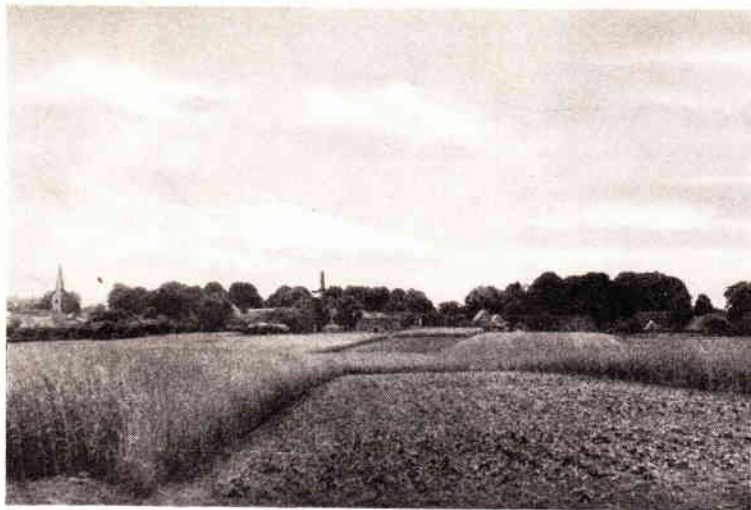
Gezicht op het dorp....

Driemaal is de gemeente vereerd met een officieel koninklijk bezoek. Op 14 Januari 1837 ontving zij Koning Willem I. Voor de uitnodiging tot een „dejeuner” ten gemeentehuize werd hoffelijk bedankt. Waar dat dejeuner zou hebben moeten plaats vinden, zal wel een moeilijke vraag geweest zijn.