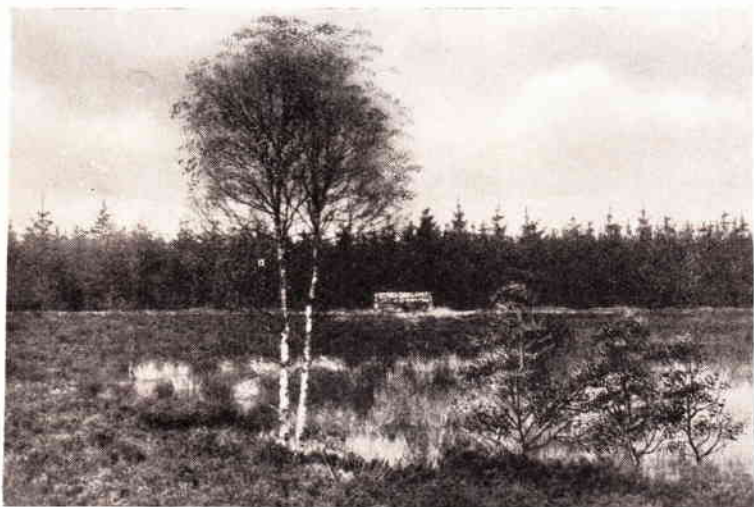
In de boswachterij Gieten: de Minister J. B. Kan-bank, die iederen voorbijganger tot een ogenblik rusten noodt en hem dan van het onvergetelijk schone schouwspel rond hem genieten doet.

In de loop der jaren is Gieten een welvarende gemeente geworden, die tot woonplaats is gekozen door velen, die in een