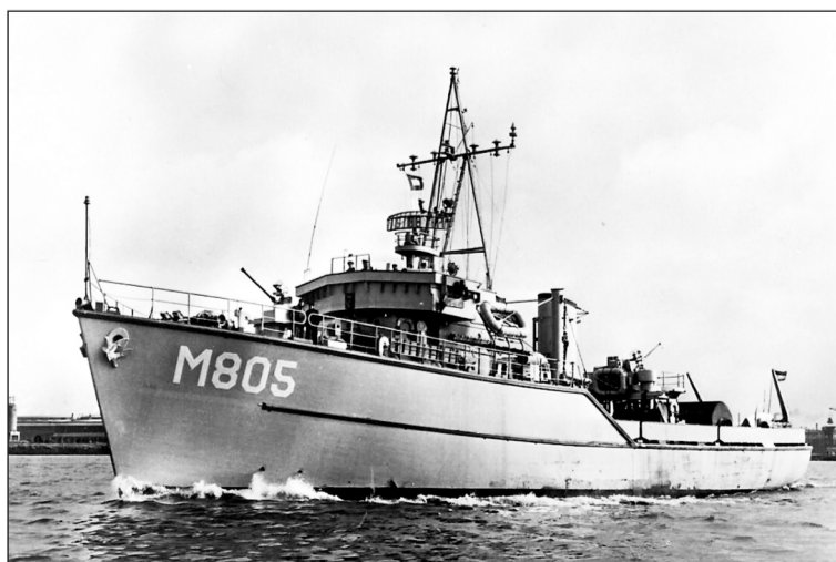
■ Mijnenveger Hr. Ms. Gieten in actie.

De mijnenveger werd tweemaal uit dienst genomen en ook weer in ere hersteld. Het marineschip werd ook voor andere doeleinden gebruikt. In juni 1956 nam Gieten deel aan de vlootshow in Rotterdam. Ook nam de mijnenveger deel aan verschillende NATO-oefeningen. Het schip lag op 1 maart 1958 in de haven van Delfzijl en hield daar open schip. Reden voor de leden van de club Vrienden van de bemanning der mijnenveger Gieten om met een mannetje of honderd vanuit Gieten naar Delfzijl te gaan om het schip te bekijken. In juni 1959 pikte de Gieten de Duitse kano-vaarder Mosebach bij Hellevoet-